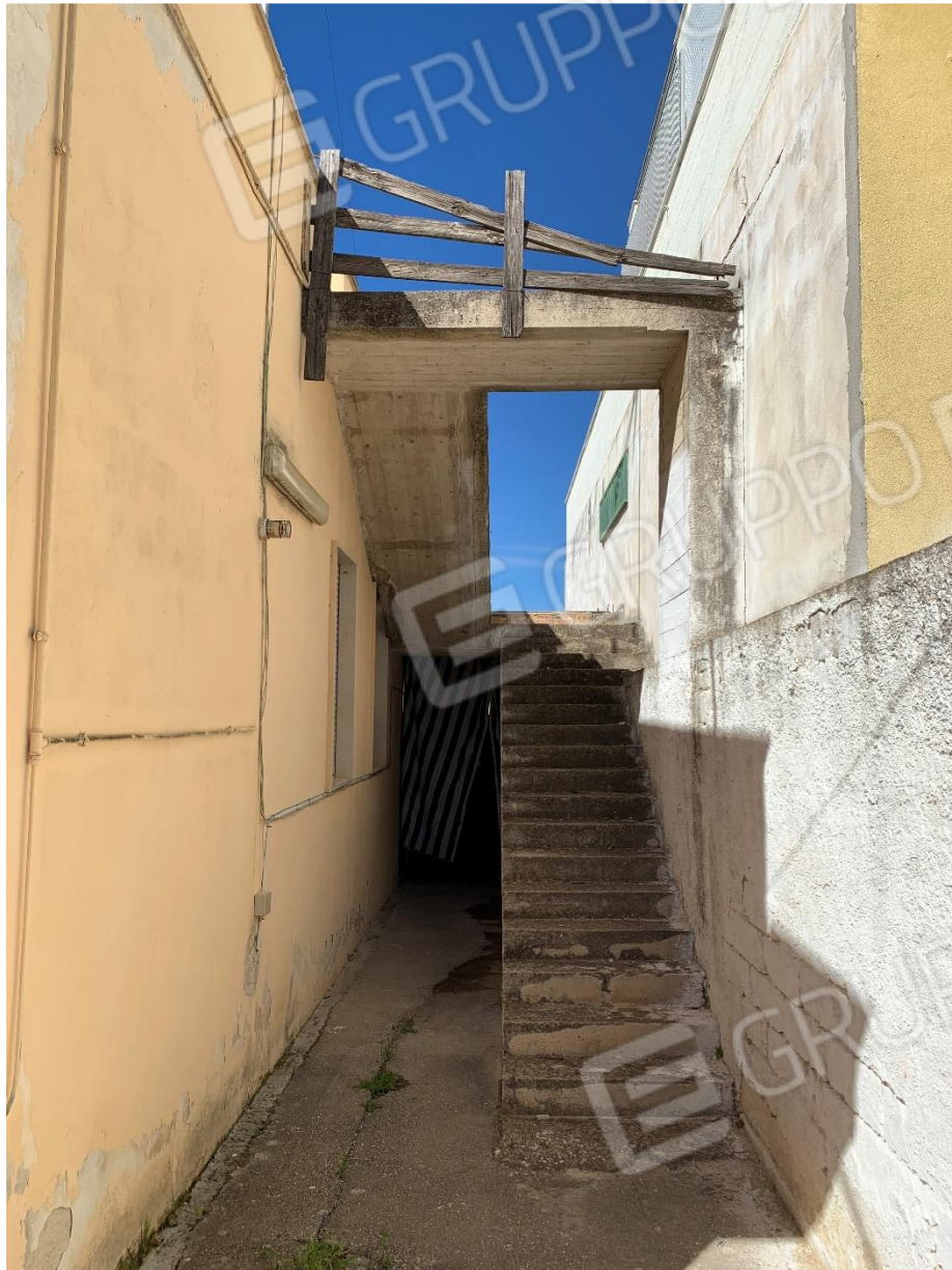
Foto 6. Dettaglio scala d'accesso lastrico solare lato Nord