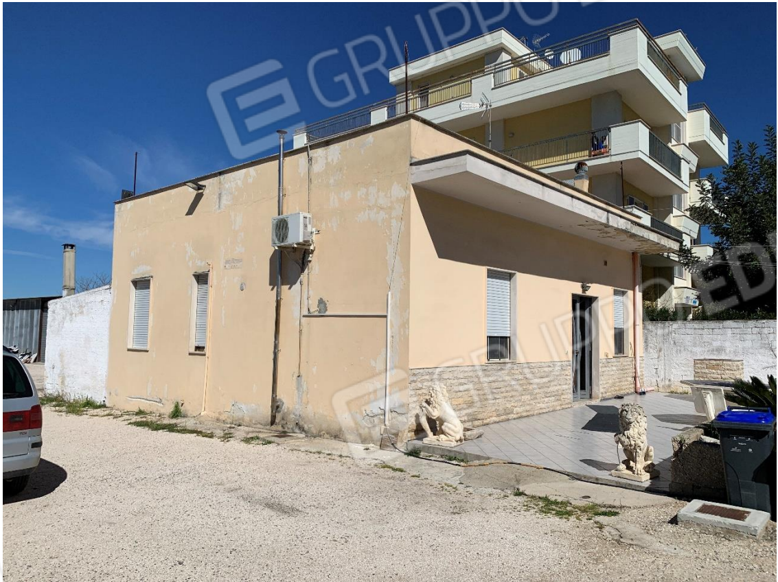
Foto 4. Vista fabbricato lato Sud - Est