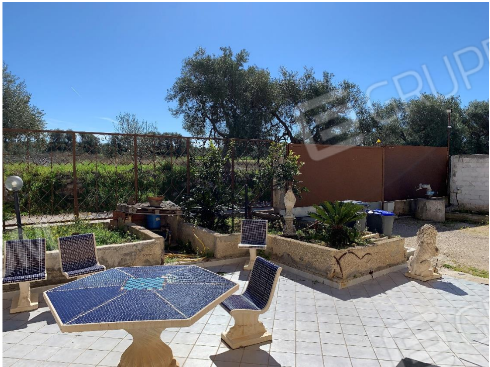
Foto 16. Terrazza a livello