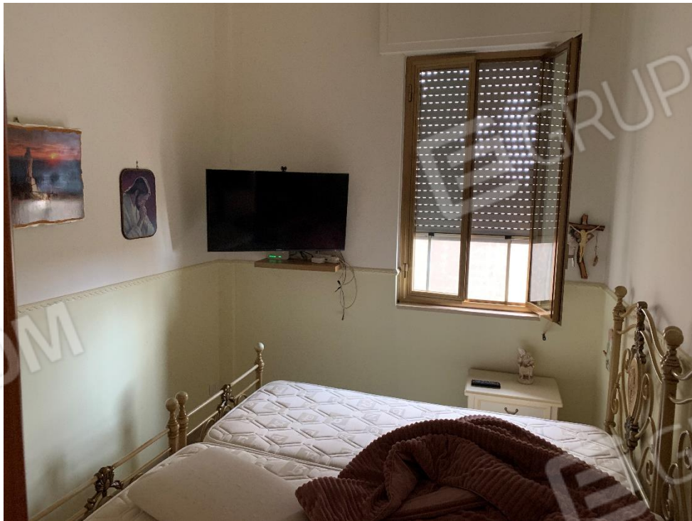
Foto 12. Camera 2