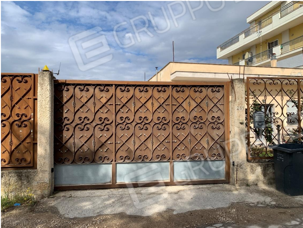
Foto 3. Vista fabbricato ingresso carrabile Via Lagnone Santa Croce, n°281