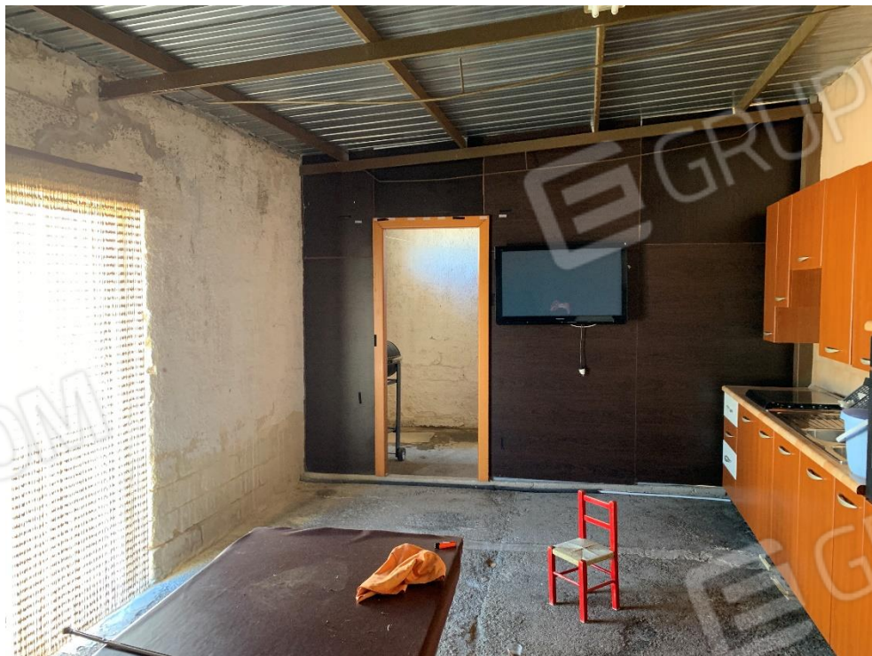
Foto 14. Tettoia chiusa