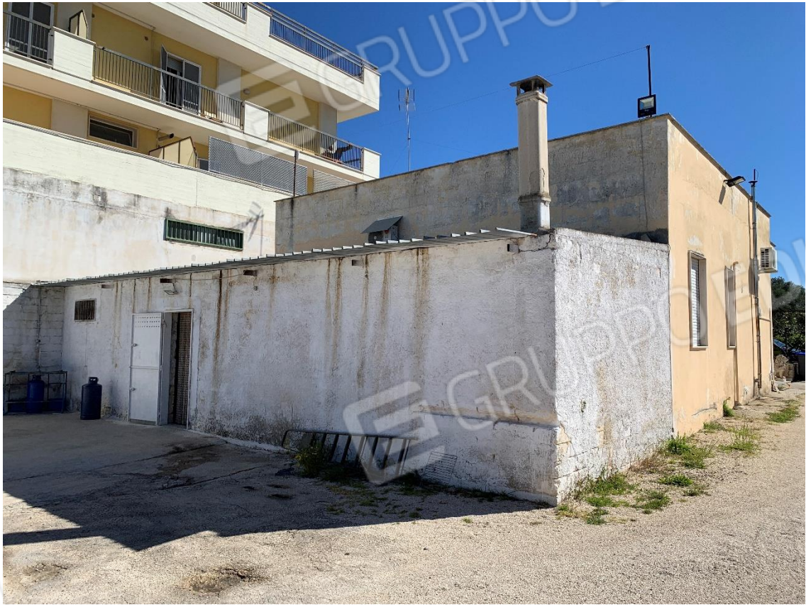
Foto 5. Vista fabbricato lato Ovest