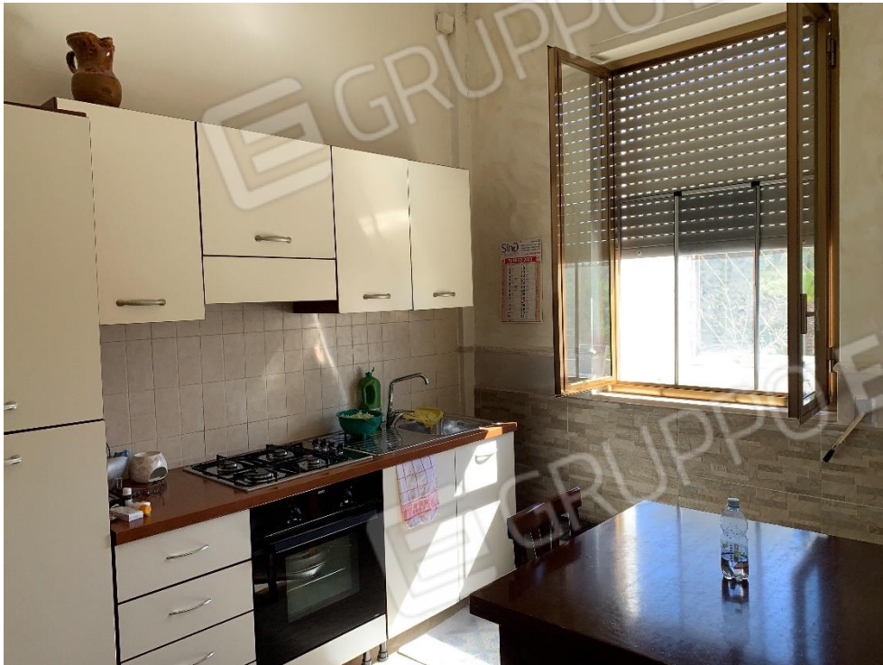
Foto 11. Cucina