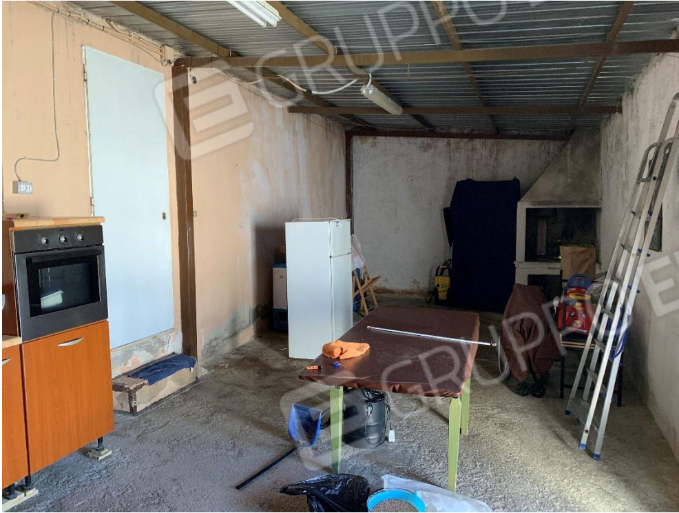
Foto 15. Tettoia chiusa