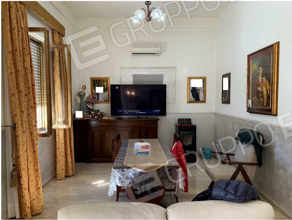
Foto 7. Soggiorno