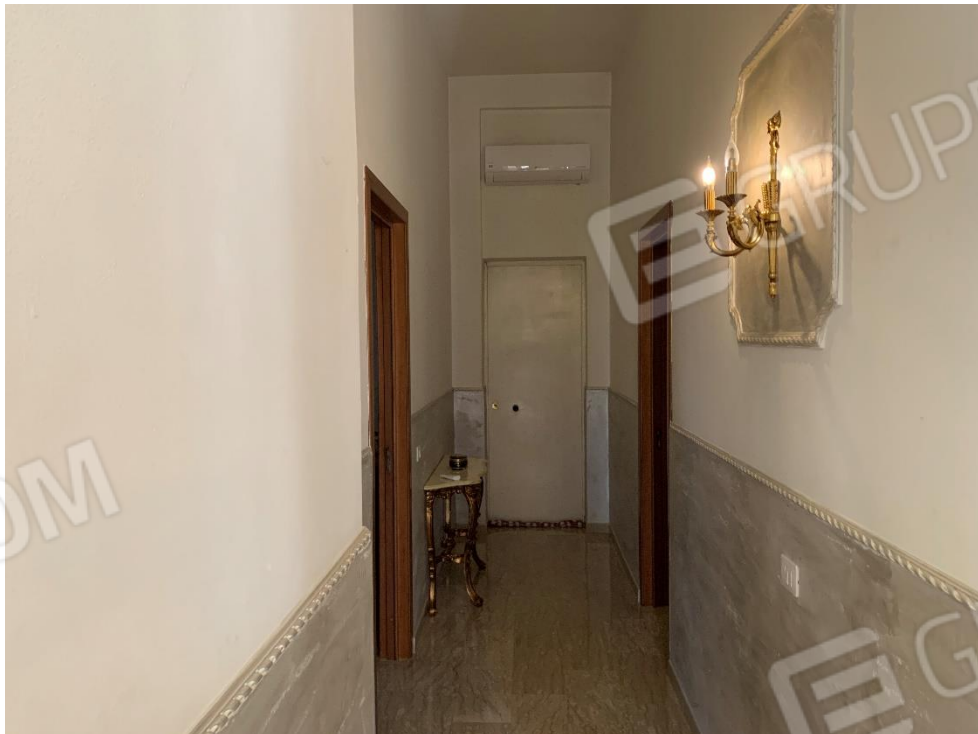
Foto 8. Disimpegno