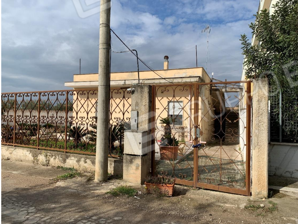
Foto 2. Vista fabbricato ingresso pedonale Via Lagnone Santa Croce, n°281