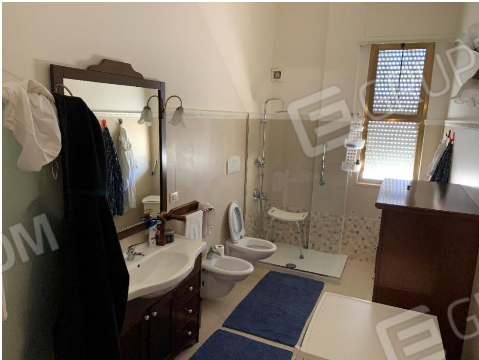
Foto 10. Bagno