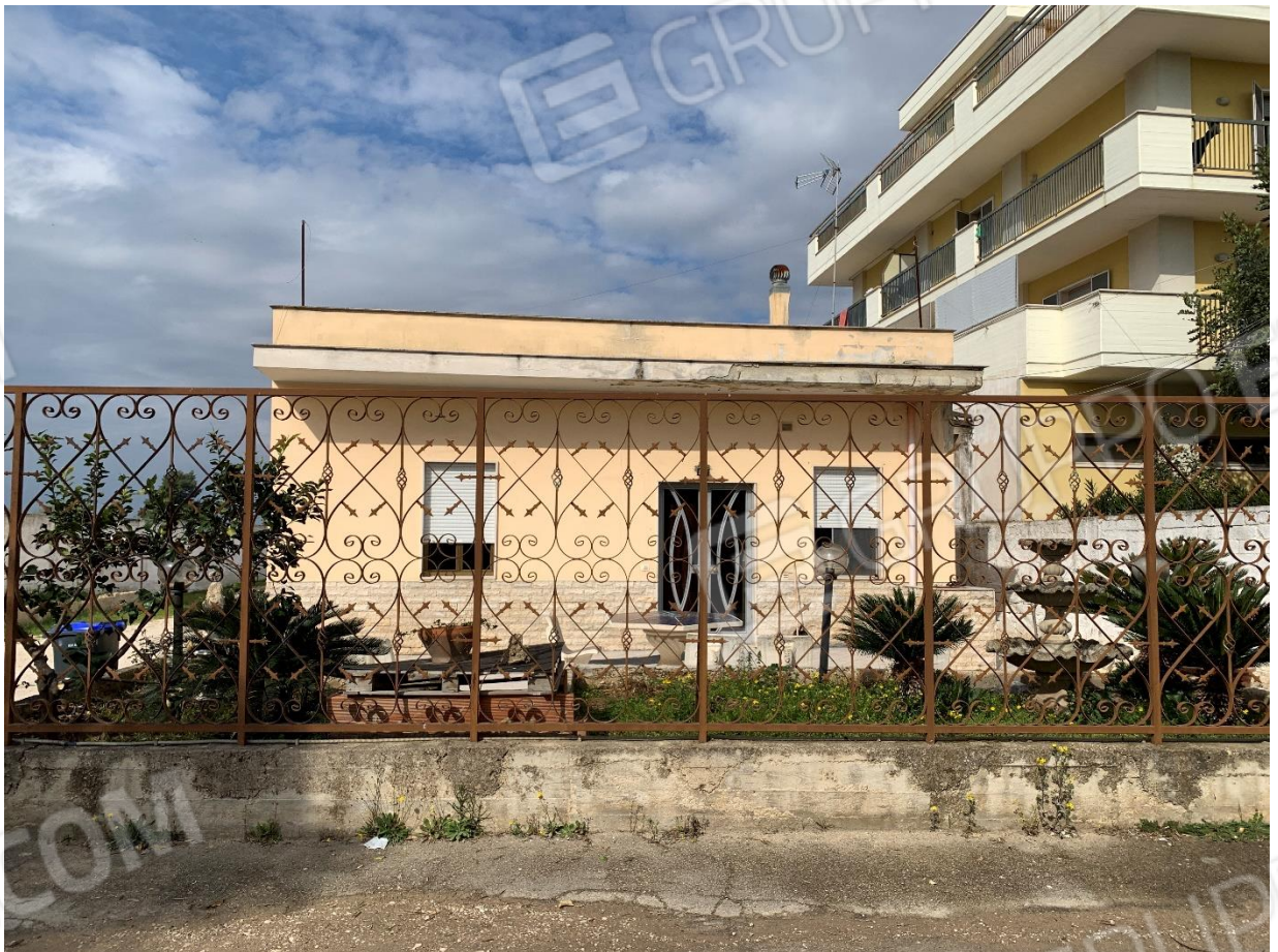
Foto 1. Vista fabbricato lato Est