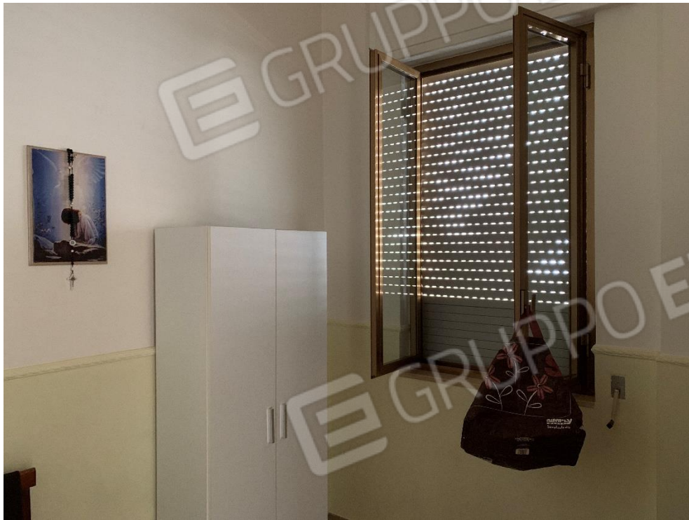
Foto 13. Dettaglio infisso anticorodal