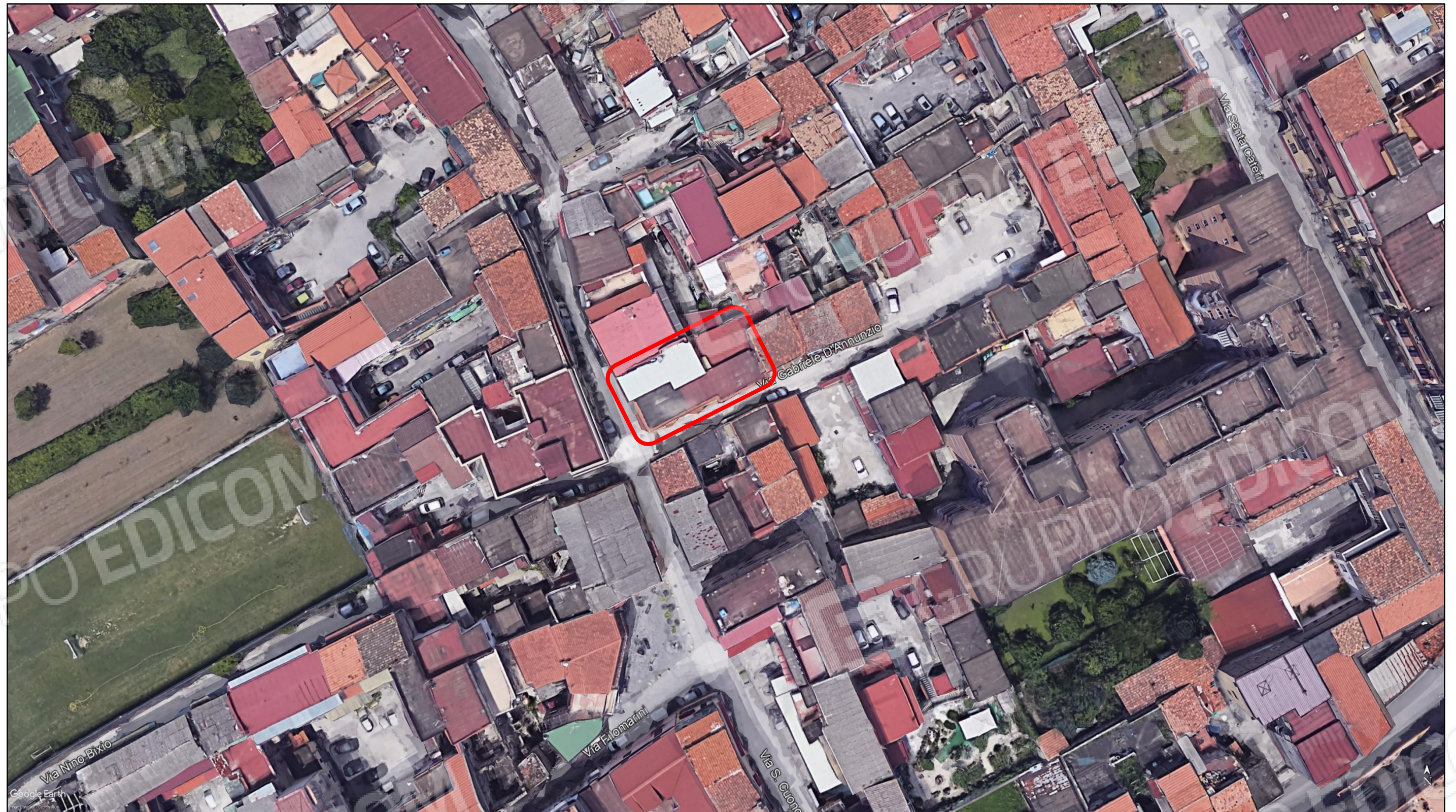
Ortofoto dei luoghi (in evidenza il fabbricato di cui sono parte le unità immobiliari pignorate)