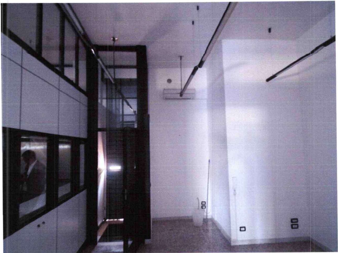
Foto 6: Stanza 1, vista dell'ingresso dal cortile retrostante, civ. 8/2