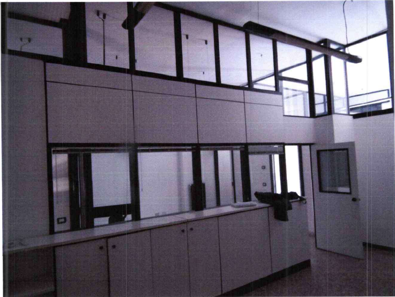
Foto 8: Stanza 2, vista della parete attrezzata di separazione con la stanza 1