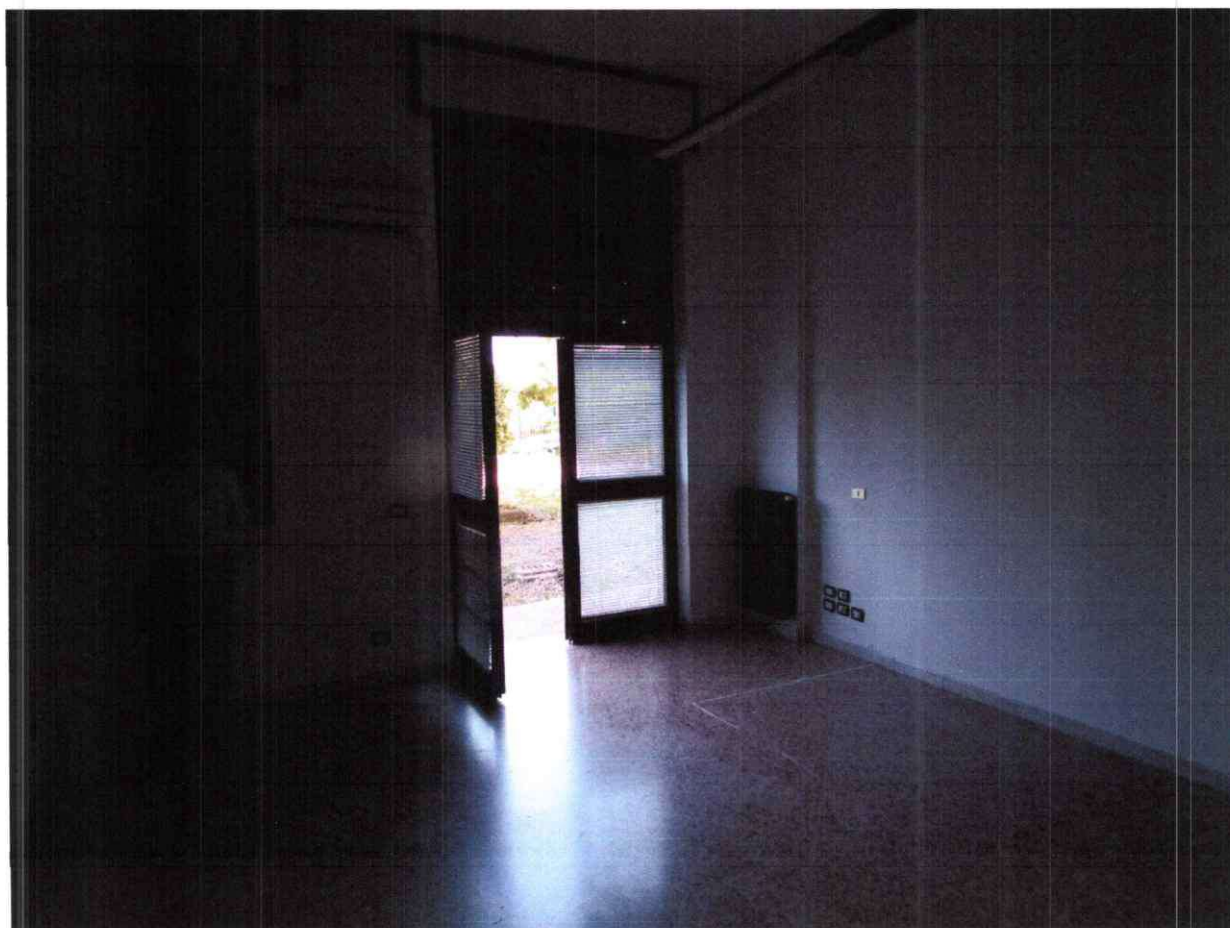
Foto 19: Stanza 4, vista dell'ingresso dal cortile antistante civ. 8/13