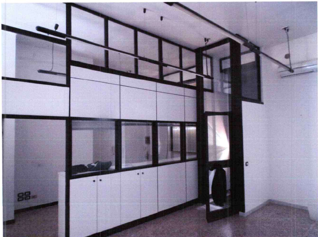
Foto 7: Stanza 1, vista della parete attrezzata di separazione con la stanza 2