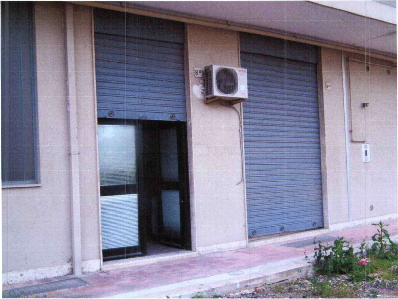
Foto 4: Ingresso dal cortile su via S. Tommaso d'Aquino, civ. 8/15 della stanza 3