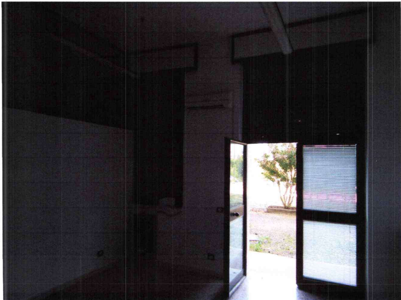
Foto 11: Stanza 3, vista dell'ingresso dal cortile antistante civ. 8/15