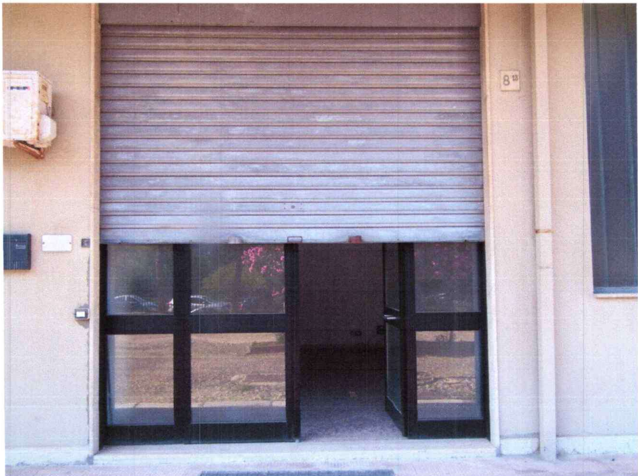
Foto 5: Ingresso dal cortile su via S. Tommaso d'Aquino, civ. 8/13 della stanza 4